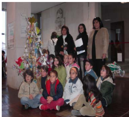
A entrega do prémio, com a presença do Sr. Vereador do Ambiente da CMA

2º Classificado: Agrupamento de escolas de Pardilhó (5º A)